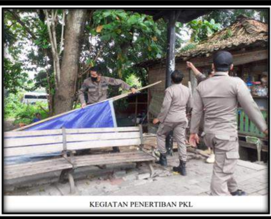
KEGIATAN PENERTIBAN PKL