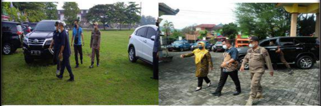
— Kegiatan Pengamanan Wakil Bupati Bantul