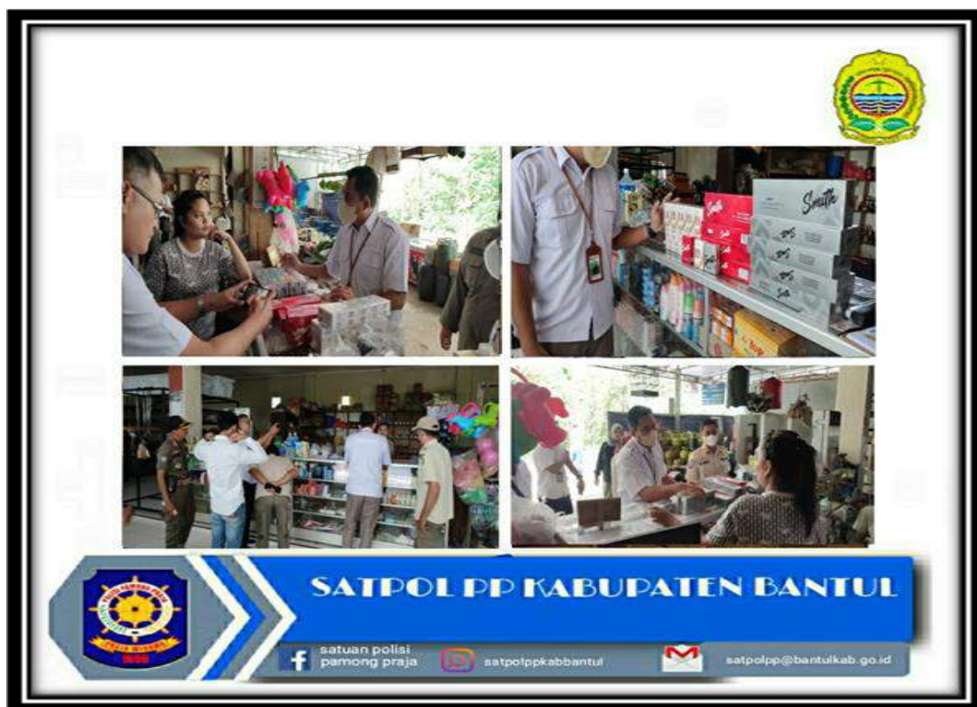
Gambar III.2 Dokumentasi Kegiatan Bidang Penegakan Peraturan Perundang-Undangan

Bidang penegakan peraturan perundang-undangan telah mencapai 11 kali proses hukum yang selanjutnya dilakukan persidangan di Pengadilan Negeri Bantul. Selain itu dilakukan kegiatan pembongkaran baliho sebanyak 10 kali kegiatan, operasi gabungan pemberantasan BKC Ilegal sebanyak 10 kali kegiatan yang didanai dari DBH-CHT, dan pemasangan papan larangan terakit sampah di 10 titik lokasi. Dalam rangka peningkatan pengetahuan dan pemahaman mengenai Peraturan Daerah, Satpol PP melakukan sosialisasi Perda sebanyak 23 kali kegiatan dan 2 kali terakit DBH-CHT, serta workshop implementasi Perda.