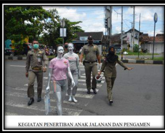
KEGIATAN PENERTIBAN ANAK JALANAN DAN PENGAMEN