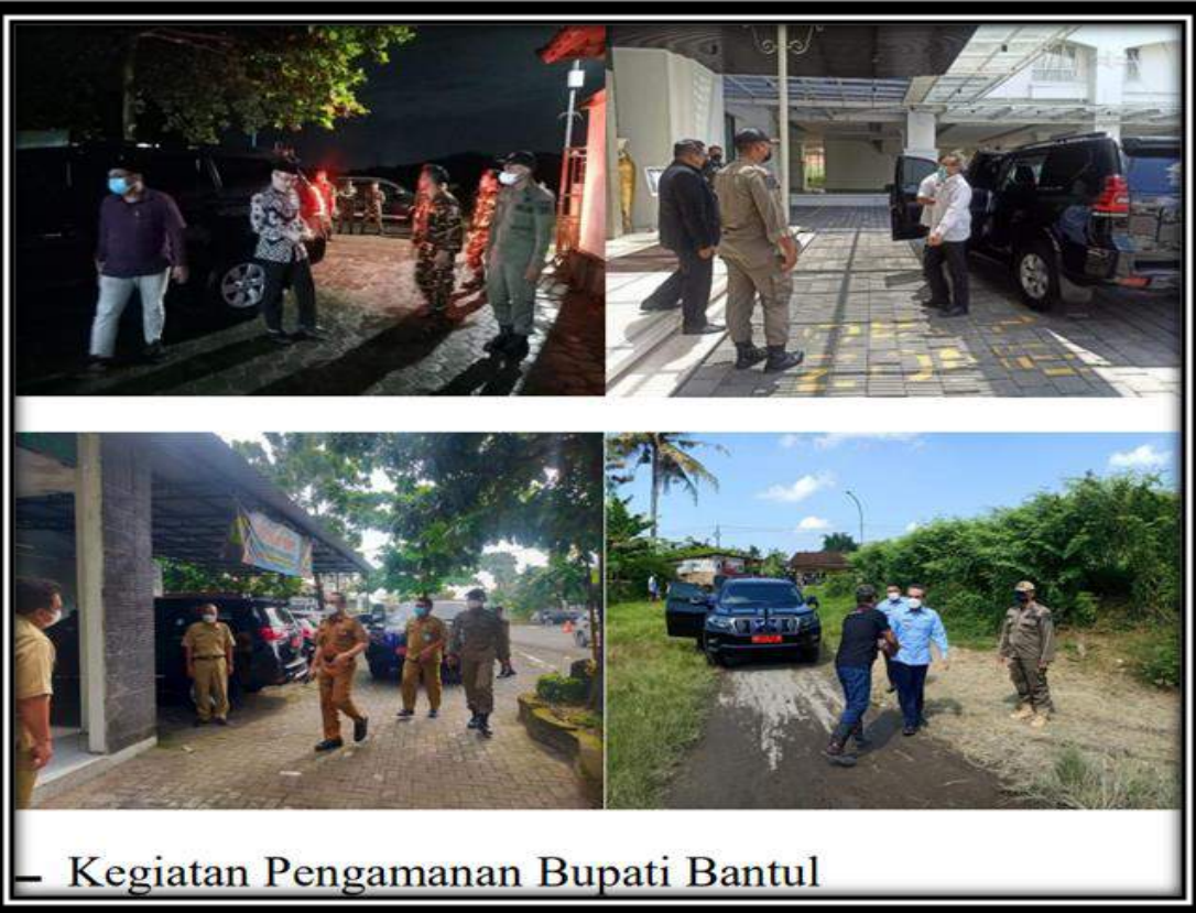
— Kegiatan Pengamanan Bupati Bantul