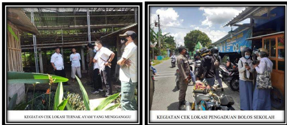
Gambar III.1 Dokumentasi Kegiatan Bidang Ketertiban Umum dan Ketentraman Masyarakat

Total kegiatan yang dicapai oleh Bidang Ketertiban Umum dan Ketentraman Masyarakat adalah sebanyak 777 kali kegiatan dengan rincian penanganan pengaduan masyarakat sebanyak 165 kali, Penertiban Anak Jalanan (Anjal) dan PKL sebanyak 38 kali yang dilaksanakan dengan memberikan pembinaan dan sosialisasi mengenai aturan yang berlaku. Untuk kegiatan penertiban anjal dilakukan bekerjasama dengan Dinas Sosial Kabupaten Bantul. Anjal yang terjaring diberikan pembinaan berupa pengarahan dan diminta kembali ke keluarga masing-masing. Dalam hal pengaduan pelanggaran yang terjadi semua dapat ditindaklanjuti baik dengan pembinaan, pemanggilan, maupun dengan penyidikan. Selain itu dalam rangka pengamanan Bupati dan Wakil Bupati, Satpol PP telah melakukan sebanyak 552 kali pengamanan.