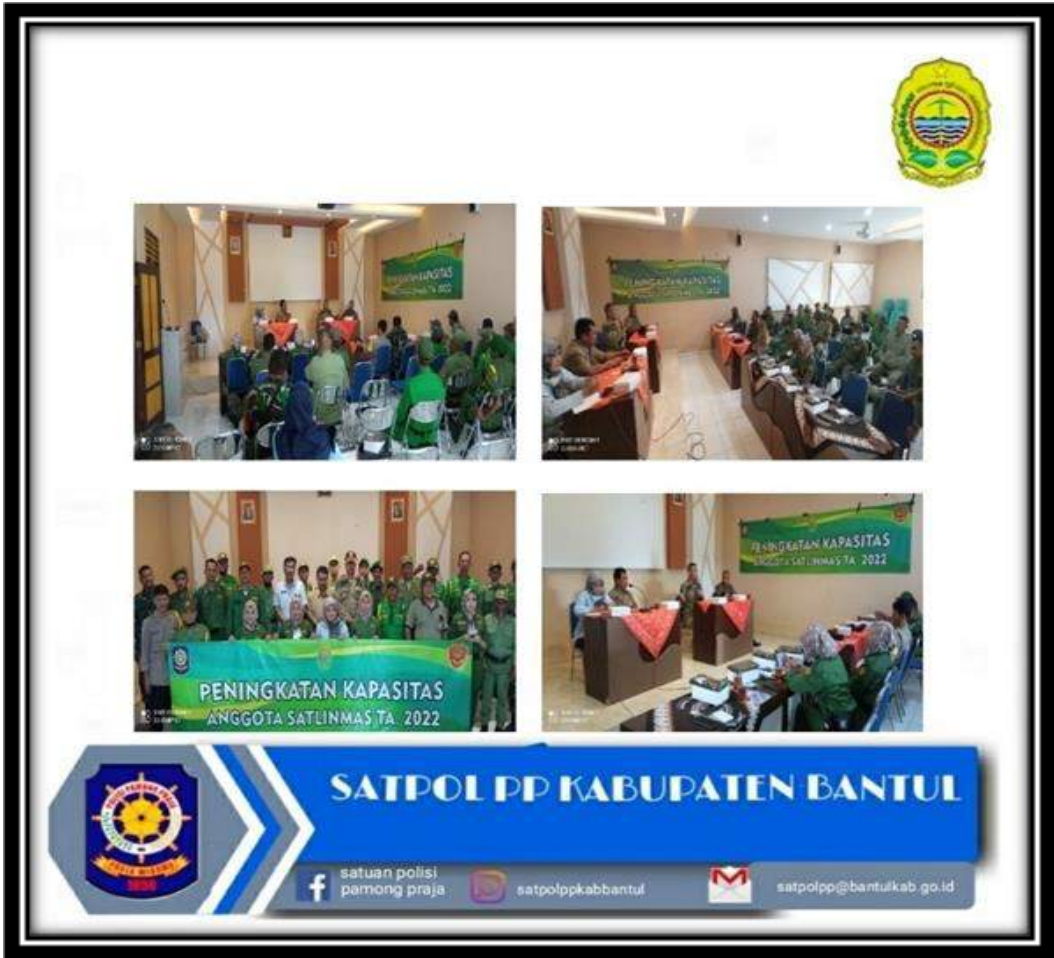
Gambar III.3 Dokumentasi Kegiatan Bidang Perlindungan Masyarakat

Bidang Perlindungan Masyarakat telah melakukan peningkatan kapasitas anggota Satpol PP dan Satlinmas sebanyak 44 kali kegiatan dan binasuluh sebanyak 48 kali kegiatan, serta penanganan laka air sebanyak 44 orang. Dari anggaran yang didanai oleh Dana Keistimewaan DIY, Satpol PP melakukan pembinaan kelompok Jagawarga sebanyak 25 dusun dan melakukan pengukuhan oleh Bupati Bantul.