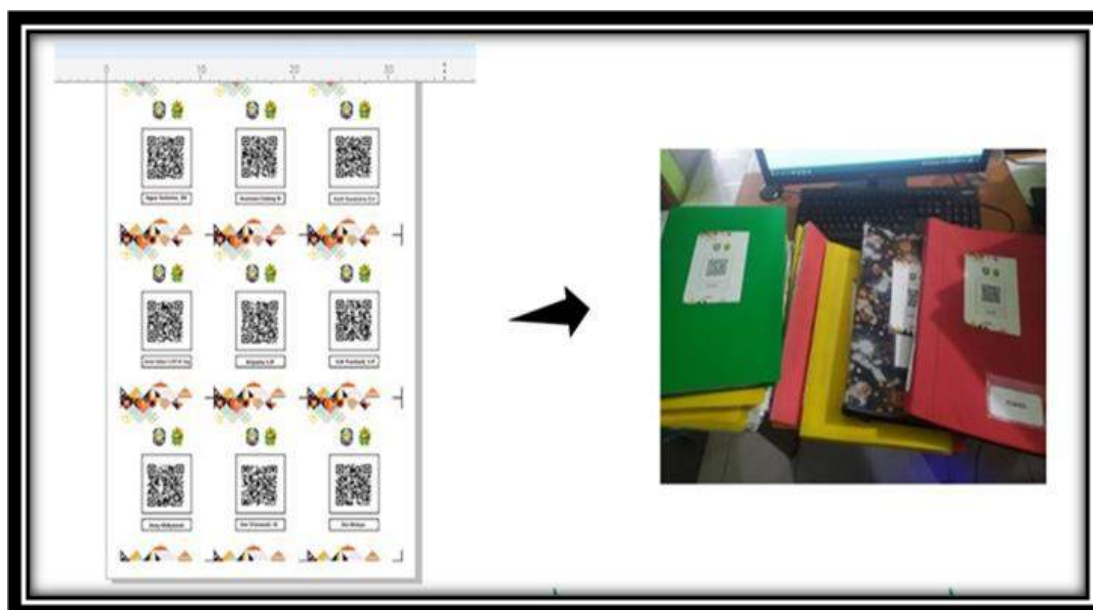
Gambar III.4 Hasil Inovasi Barcode Arsip Kepegawaian