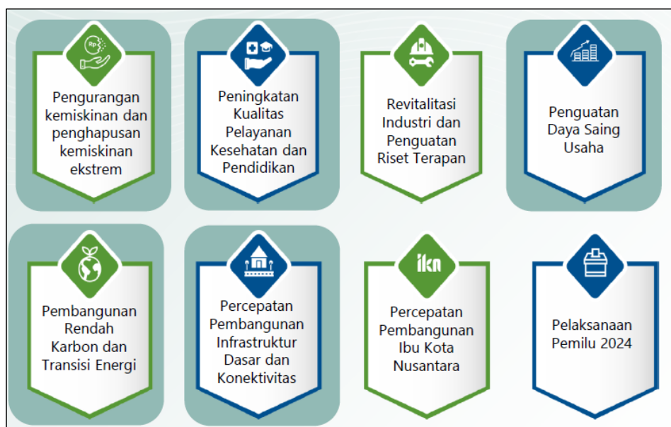
Gambar 3.1 Arah Kebijakan RKP Tahun 2024

Pada Tahun 2024, Tema Pembangunan Nasional yang ditetapkan dalam RKP Tahun 2024 adalah "Mempercepat Transformasi Ekonomi yang Inklusif dan Berkelanjutan" dengan 8 arah kebijakan sebagai berikut: